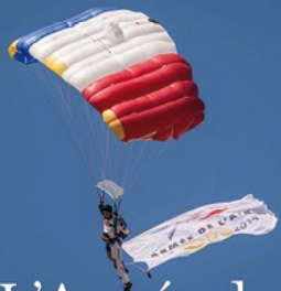
L'Armée de l'Air