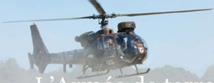
L'Armée de terre