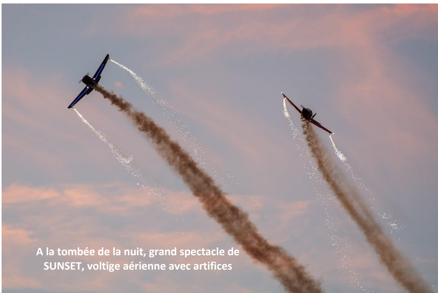
A la tombée de la nuit, grand spectacle de SUNSET, voltige aérienne avec artifices